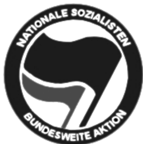
46. Logo der AN's. Unterscheidet sich nicht vom Antifa-Logo, nur dass bei diesem die schwarze Fahne vorne ist. Bei dem traditionellen Antifa-Logo ist die rote Fahne vorne.