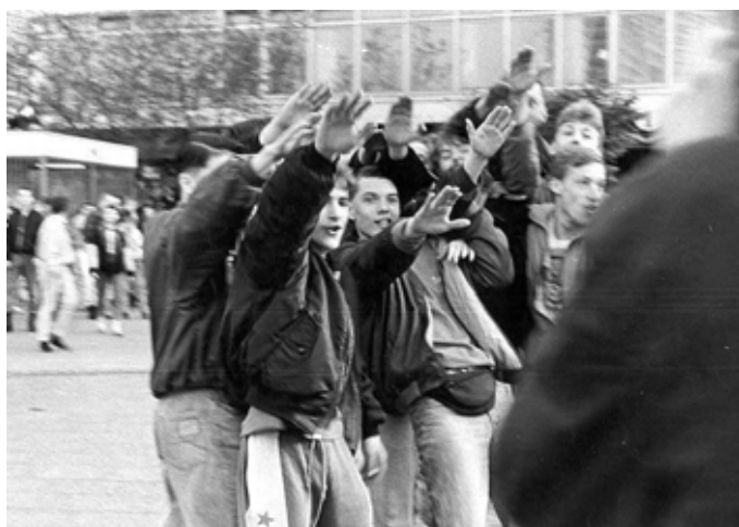
24. März 1990, Berlin-Alexanderplatz: Hools des Berliner Fußballclub Dynamo nach einem Punktspiel 1.