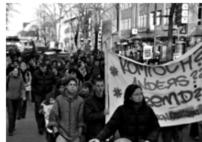
50. Vergangene Antirassismusedemonstration