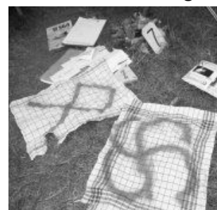
16. Handtücher mit aufgespürten Hackenkreuzen und Runen

Die Nähe zum Nationalsozialismus und sogenannten „ Neuheidentum “ war bei der HDJ gang und gebe. Eine Reichskriegsfahne war das wichtigste Utensil jeder Veranstaltung. Zelte bekamen Namen wie „ Führerbunker “ oder „ Germania “. Als die Polizei im August 2008 ein Zeltlager in der Nähe bei Rostock aus- hob, beschlagnahmten die Beamten Spültücher mit aufgemalten Hackenkreuzen und Tagebücher mit SS-Runen.