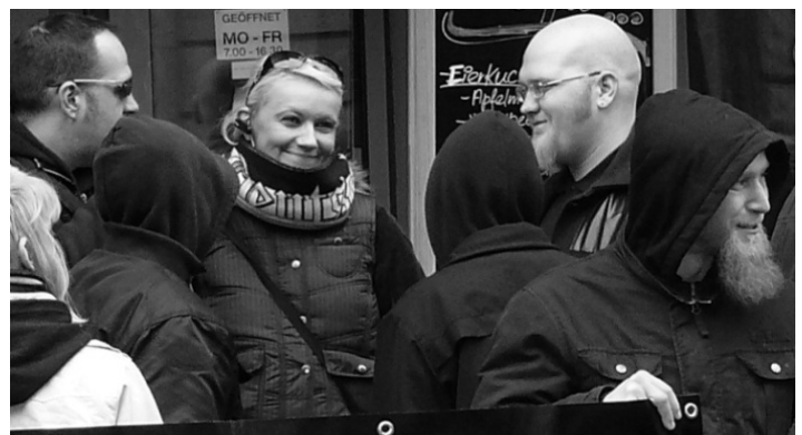
32. Frau aus Gransee bei einer Frontbann Kundgebung in Berlin-Moabit

Damit diese nicht stärker werden ist eine starke Zivilgesellschaft notwendig, aber auch eine starke antifaschistisch geprägte Jugend.