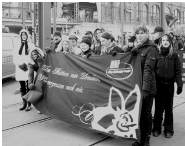
13. 1.v.r. Hennigsdorferin aus den Spektrum der Hennigsdorfer Kameradschaften