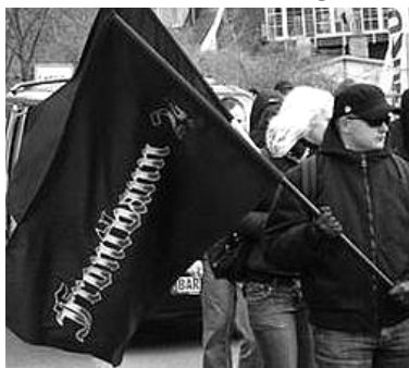
33. Der Frontbann bei dem Aufmarsch in Lehnitz am 22.3.09

Am 14. Februar 2009 waren Antifaschist_Innen aus Berlin und Brandenburg ziemlich überrascht, als es