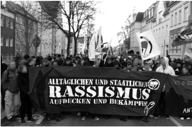
51. Antira Demo im März 2009

Aktion in Lehnitz, bei der Neonazidemonstration durchzuführen, sondern alle möglichen Kräfte für die Antira-Demo zu mobilisieren, um ein noch klareres Zeichen gegen Rassismus aber auch gegen die in Lehnitz laufenden Nazis zu setzen. Diese Demonstration fand eine Stunde vor der in Oranienburg und weit entfernt von der anderen Demoroute statt.