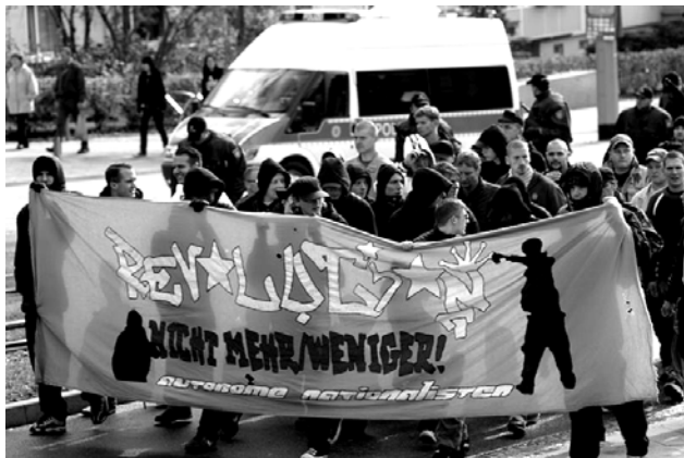
48. Autonome Nationalisten bei einer NPD Demo am 7.10.06 in Nordhausen

rum, dass sein Einstieg damit zusammen hing, wer attraktiver ist vom Auftreten, der Musik und der subkulturellen Prägung. Es sind weder die politischen Inhalte der NPD, der Freien Kräfte noch die der Autonomen Nationalisten. Es ist schlichtweg die Subkultur. Und diese war schon immer der Einstieg der Jungnazis in die Szene.