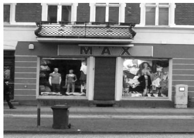
40. M.Ä.X in der Bernauer Straße, Oranienburg

In Oranienburg befindet sich ebenfalls ein Laden, der mehrere Textilien verkauft die bei Neonazis beliebt sind. Neben diesen bietet, der in der Bernauer Straße ansässige M.Ä.X. , die Neonazimarkte Thor Steinar an. Es ist davon auszugehen, dass der Laden dies