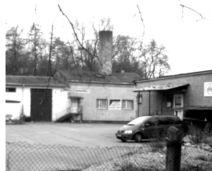
41. Neonaziladen „Adler“ in der Lehnitzstraße, Oranienburg