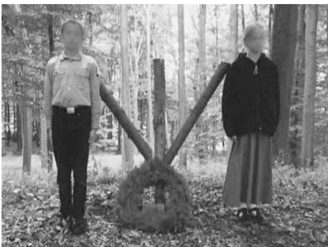
15. HDJ Aktivist_Innen in traditioneller Uniform, nach Geschlecht unterschieden

Laut Vereinssatzung war die Hauptaufgabe der HDJ „ die Jugend zu dem Nächsten hilfreichen, der Heimat und dem Vaterland treuen und dem Gedanken der Völkerverständigung aufgeschlossenen Staatsbürgern “ heranzubilden. Ein weiteres Ziel war es die ganze Familie an die extrem rechte Szene zu binden. Durch das so genannte „ Lebensbündkonzept “ versuchte die HDJ zu verhindern, dass ältere Mitglieder nach Familiengründung aus der rechtsextremen Szene ausschieden. Mensch versuchte eine Art Volksgemeinschaft im nationalsozialistischen Vorbild aufzubauen.