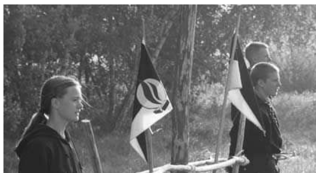
14. HDJ Aktivist_Innen mit der Vereinsfahne

Die letzte große Neonaziorganisation, die in Oberhavel aktiv war und am 31. März 2009 verboten wurde, ist die ( Heimattreue Deutsche Jugend (kurz HDJ ). Die HDJ war ein elitärer völkisch-nationaler Verein, der dazu diente Kinder und Jugendliche im Alter von 7-29 Jahren an den Nationalsozialismus zu binden. Nach außen gab sich die HDJ als weitgehend unpolitischer Träger der Jugendarbeit. In Wahrheit aber wurden Kindern und Jugendlichen