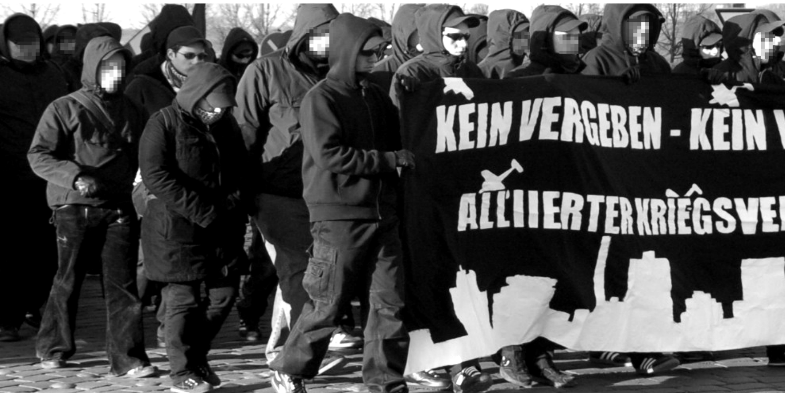
45. Autonome Nationalisten beim Gedenkmarsch in Dresden im Februar 2009

Rostock und Hoyerswerda, stellten Neonazis um Christian Worch fest, dass der prollige Skinhead in der Öffentlichkeit kein gutes Bild abgibt. Darüber hinaus zwangen Parteienverbote Neonazis