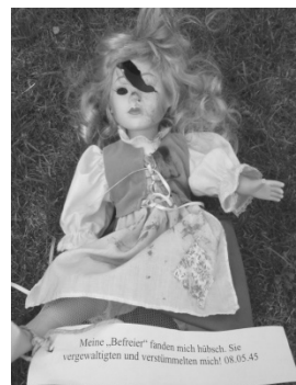
9. Puppenaktion der JN am 8.Mai.08

visionistische Flugblätter auf, die den 8. Mai tisierten. An dem Tag selbst waren auf einmal in der ganzen Stadt reien mit dem Spruch „8. Mai - Tag der Schande“ zu entdecken und an einigen Stellen lagen Porzelpuppen aus, deren Köpfe