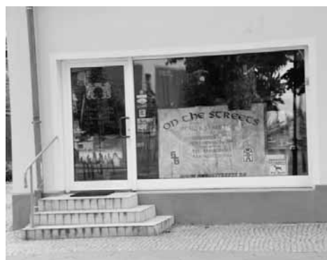
39. Der Naziladen "On The Streets" in Hennigsdorf

Neben der Musik spielt natürlich der Dresscode eine wichtige Rolle. Über ihn können sich Neonazis verständigen oder eine Drohkulisse aufbauen. Es ist nicht verwunderlich, dass gerade in den drei