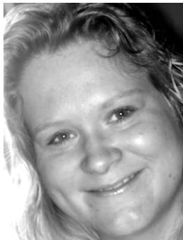
37. Schlagzeugin von Autan auf ihren Jappy Profil

Eine weitere bei Neonazis beliebte Band ist die Onkelz-Coverband Dick & Durstig . Die Band selber ist zwar nicht dem neonazistischen Spektrum zuzuordnen, aber bei ihren Konzerten findet sicher immer wieder eine große Anzahl subkultureller Neonazis ein. Bereits die Originalen Böhse Onkelz ermöglichen jungen Menschen aufgrund ihrer älteren Texte einen „soften“ kulturellen Einstieg in die Neonazisubkultur. Dies findet vermutlich auch unter den Fans von Dick & Durstig statt. Sie ist die zugkräftigste Band Oberhavels.